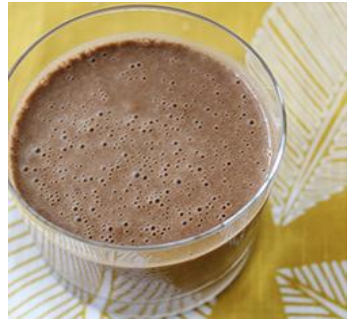
Рецепт смузи с какао

Информацию о мероприятиях смотрите на сайте!