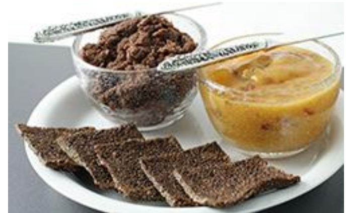
Рецепт шоколадных крекеров с семенами чиа